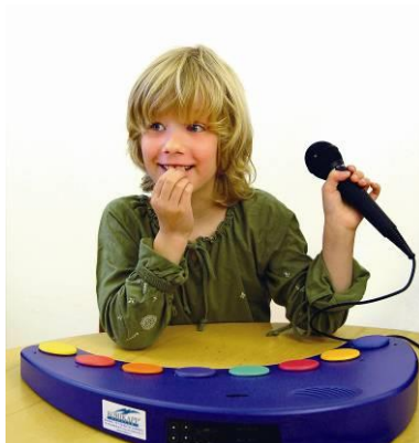
Spille inn lyd via mikrofon eller fra ekstern lydkilde som f.eks pc.