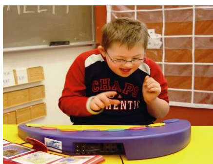
Spille av forprogrammert lyd!

Dette kan du gjøre med Paletto Plus modellen: