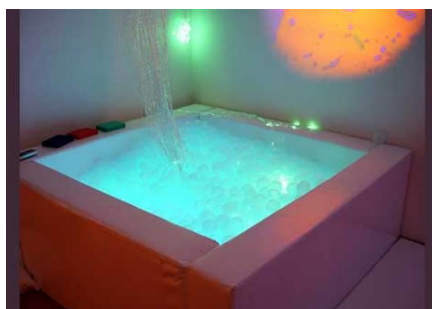
Styre fargene i ballbassenget!